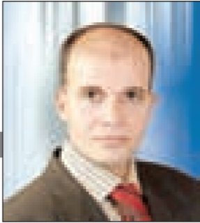
معلم أول جغرافيا